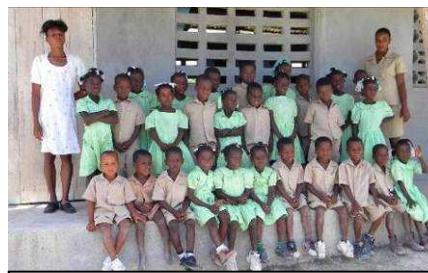
La classe des grands

Avril 2009 : Accompagnés d'un représentant de notre partenaire nantais, l'association 'Les Papiers de l'Espoir', nous avons été accueillis une dizaine de jours en avril-mai 2009 à Gentillote, chez un habitant membre de l'association Ayiti Solidarité des Paysans et Amis de Gentillote (ASPAG).